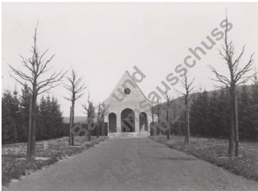
Die nahezu fertige Friedhofskapelle, vermutlich im Frühjahr 1938. Um den Blick auf die Hauptfassade zu fokussieren wurde am Wegon der Kalandstraße aus eine Baumallee gepflanzt. Die Wirkung des symmetrisch gestalteten Westgiebels wurde dadurch noch unterstrichen.

Das heute auf der Giebelwand angebrachte Kreuz war im Entwurf von 1938 zwar vorgesehen 7 , es wurde aber während der NS-Diktatur nicht angebracht. Erst ein Beschluss aus dem Jahr 1946 sorgte dafür, dass die Kapelle ein Kreuz bekam. 8