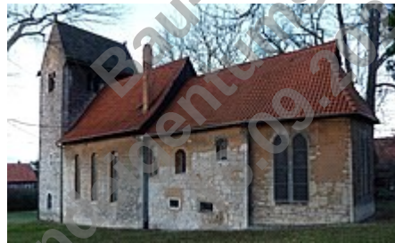
St. Cosmas und Damian in Rheden, 13. Jahrhundert

Die Alfelder Friedhofskapelle wurde aus Thüster Kalkstein (Serpulith) gebaut. 12 Die verschiedenen Teile ihres Baukörpers beziehen sich auf ältere Architekturformen, die überall im Leinebergland zu finden sind, zum Beispiel romanische bzw. neoromanische Kirchen und niederdeutsche Bauernhäuser. Gerade der Rückgriff auf eine Bauernhaus-Form für die Rückseite des Gebäudes, war vermutlich nicht nur konservativ bodenständig gemeint, sondern verwies auch auf die Blut-und-Boden-Ideologie der Nationalsozialisten.