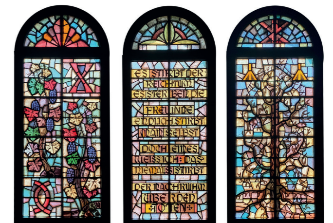
Die Fenster der Friedhofskapelle sind ein Entwurf von Heinz Meyer aus Alfeld.