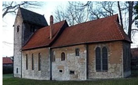
St. Cosmas und Damian in Rheden, 13. Jahrhundert

Die Alfelder Friedhofskapelle wurde aus Thüster Kalkstein (Serpulith) gebaut. 12 Die verschiedenen Teile ihres Baukörpers beziehen sich auf ältere Architekturformen, die überall im Leinebergland zu finden sind, zum Beispiel romanische bzw. neoromanische Kirchen und niederdeutsche Bauernhäuser. Gerade der Rückgriff auf eine Bauernhaus-Form für die Rückseite des Gebäudes, war vermutlich nicht nur konservativ bodenständig gemeint, sondern verwies auch auf die Blut-und-Boden-Ideologie der Nationalsozialisten.