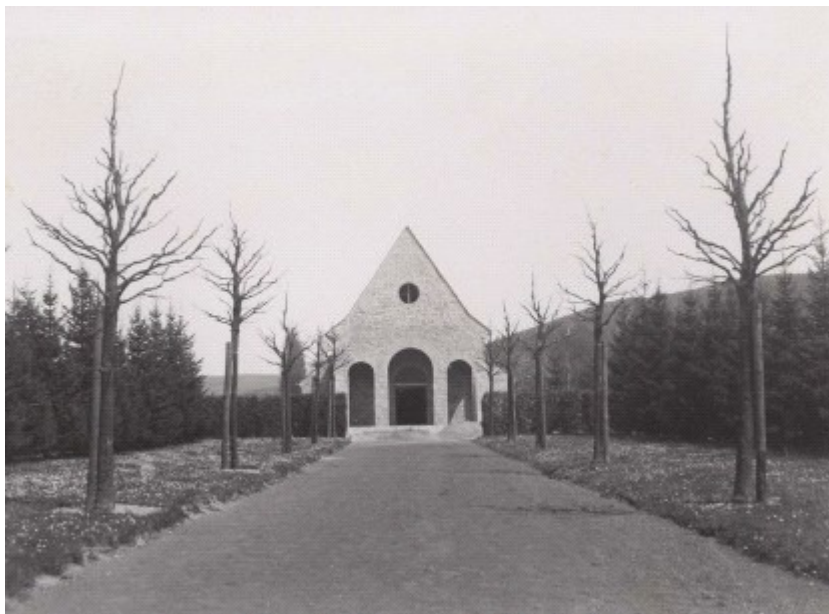
Die nahezu fertige Friedhofskapelle, vermutlich im Frühjahr 1938. Um den Blick auf die Hauptfassade zu fokussieren wurde am Wegon der Kalandstraße aus eine Baumallee gepflanzt. Die Wirkung des symmetrisch gestalteten Westgiebels wurde dadurch noch unterstrichen.

Das heute auf der Giebelwand angebrachte Kreuz war im Entwurf von 1938 zwar vorgesehen 7 , es wurde aber während der NS-Diktatur nicht angebracht. Erst ein Beschluss aus dem Jahr 1946 sorgte dafür, dass die Kapelle ein Kreuz bekam. 8