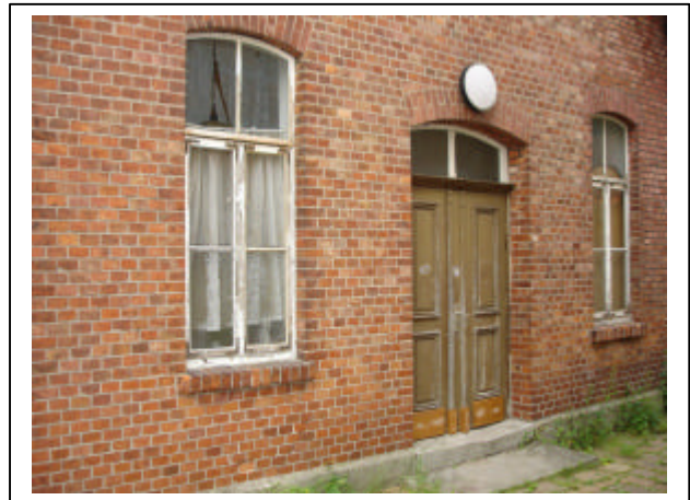
Ehemalige Grundschule Dehnsen

Für den Bereich „Nord-West“ ergibt sich für die Hallen Gerzen und Limmer nach den Schließungen der Grundschulen kein Schulsportbedarf mehr. Die Auslastungen aller drei Hallen an Vormittagen ist somit nicht gegeben. An Nachmittagen sind die Hallen auch nur in der „Wintersaison“ durch die Fußballzeiten ausgelastet. Die Turnhalle Limmer „profitiert“ zurzeit auch noch durch die Nutzung des TSV Föhrste, die nach der Einweihung der neuen Turnhalle entfallen wird. Problematisch ist die Heizungssituation in Limmer, die ggf. auch kurzfristig erneuert werden müsste.